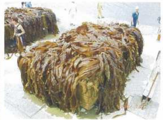
2005年7月引き揚げ調査