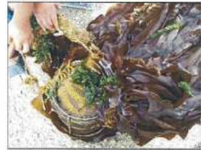
34 日目引き上げ直後