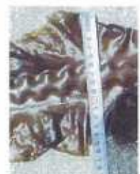
採取昆布寸法測定：L=1.5m W=17cm