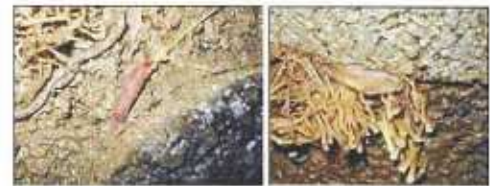
海藻以外の付着物確認