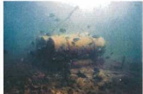
2002年7月 微生物を餌に小魚が集まる